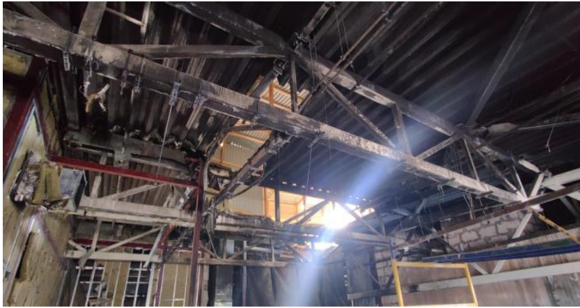
Рис. 2. Руйнування ТРЦ в місці вибуху