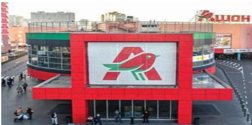
Рис. 1. Загальний вигляд торгово-розважального комплексу

Проведено чисельне моделювання пошкоджених конструкцій, визначений напружено-деформований стан всіх елементів споруди, з використанням власного програмного забезпечення та сучасного розрахункового комплексу LIRASAPR, для розробки проєкту реконструкції з рекомендаціями щодо усунення виявлених пошкоджень та можливості подальшої безпечної експлуатації [7, 8, 9, 10]. Авторами запропоновано декілька варіантів, на основі створеної просторової чисельної моделі будівлі ТРЦ для вибору оптимального варіанту проєкту реконструкції.