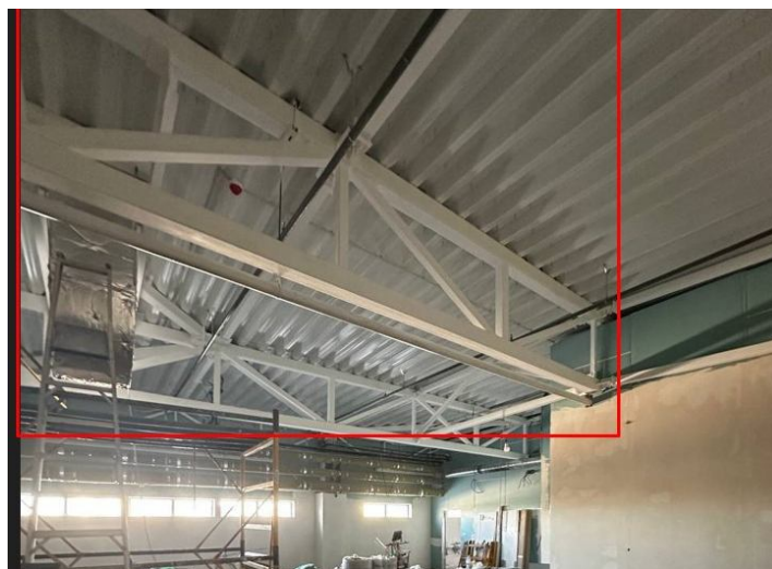
Рис. 7. Відновлена частина покриття з обладнанням

Висновки. Створена методика чисельного моделювання комплексної просторової моделі дослідження та аналізу напружено-деформованого стану, міцності та жорсткості пошкоджених та споруд на основі результатів інженерного обстеження візуальними та експериментальними методами, дозволяє значно прискорити прийняття оптимальних проектних рішень та створювати перспективні розробки на основі висновків про міцнісні характеристики конструкцій та будівлі в цілому. Впровадження розробленої методики в практику проєктування та відновлення пошкоджених споруд спрямовано на вирішення важливої соціально-економічної та наукової проблеми, що принесе в подальшому значний економічний ефект.